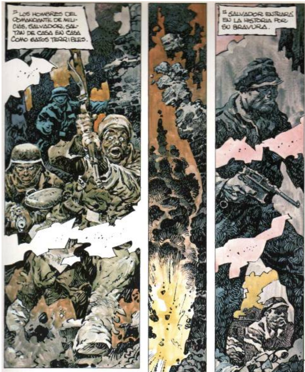
Illustration 2 : AntonioHernández Palacios, Eloy, uno entre muchos , Vitoria, Ikusager, 1979, p. 17, cases 1-2.