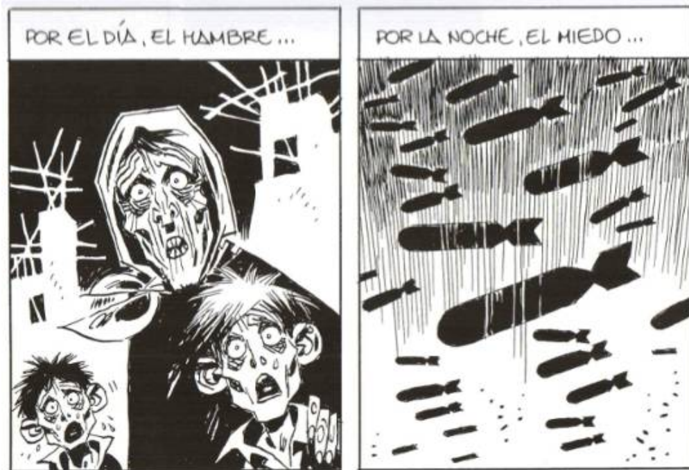
Illustration 3 : Carlos Giménez, 36-39. Malos Tiempos , vol.3, Barcelone, Glénat, 2008, p.7, cases 2-3.