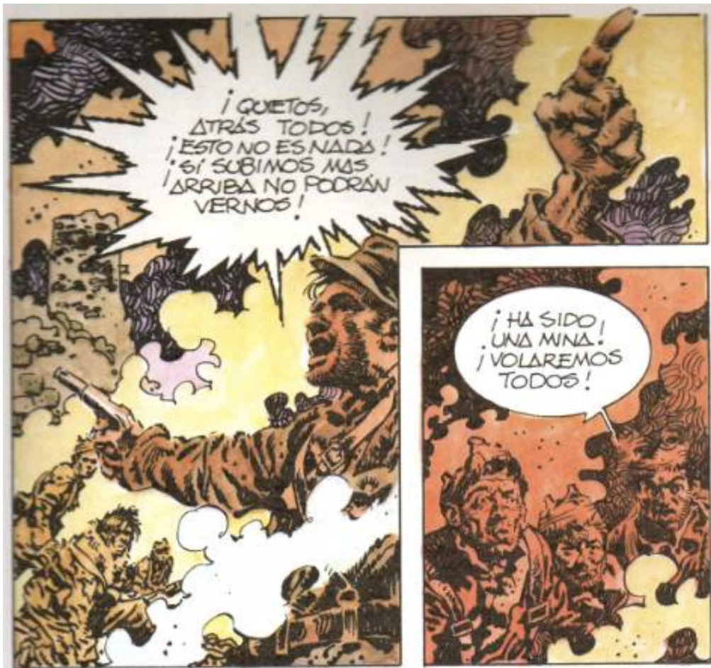
Illustration 1 : AntonioHernández Palacios, Río Manzanares , Vitoria, Ikusager, 1979, p. 21, cases 1-2-3.