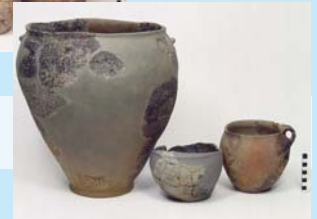
Céramiques de Sutz-Lattrigen, Riedstation (Hafner et Suter, 2000, CD/4.1/51)