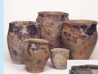
Céramiques de Nidau BKW Couche 5 (Hafner et Suter, 2000, CD/4.1/52)