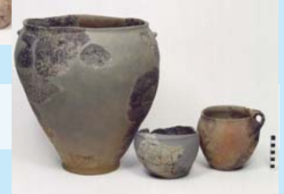
Céramiques de Sutz-Lattrigen, Riedstation (Hafner et Suter, 2000, CD/4.1/51)