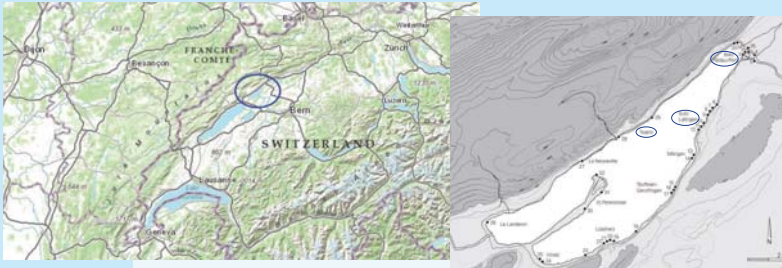
Situation des trois sites palafittes (Géoportail et Hafner et Suter, 2003, p. 29, fig. 18)