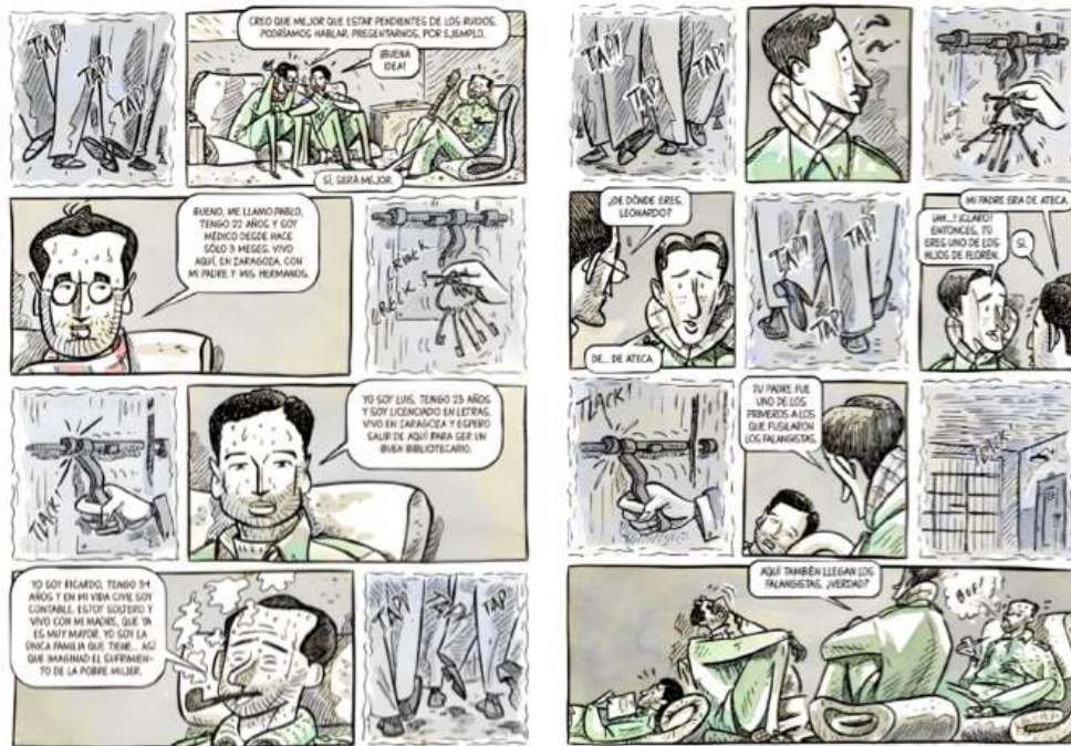
© Astiberri, p. 84 et 90.