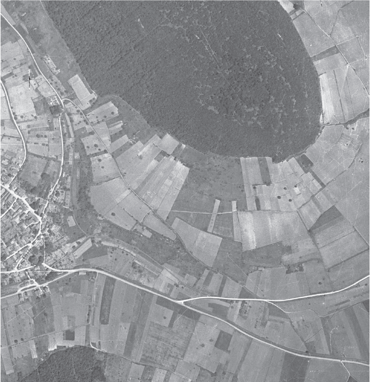
Figure 2. photographie aérienne de l'IGN du 3 juin 1940.

Sises à gauche de cette marque, les vignes du climat « En Charlemagne » côtoient, côté Aloxe-Corton, « Le Charlemagne » puis, « Les Chaumes » (en bas) et « les Pougets » tout à droite de l'ensemble. Enfin, entre les deux routes, à gauche de la patte d'oie, se distinguent les vignes des « Noizets ».