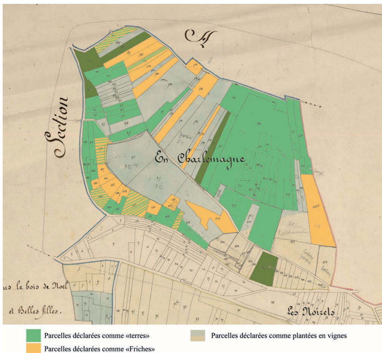
Figure 3. cartographie de l'utilisation des terres sur le climat « En Charlemagne » à Pernand-Vergelesses en 1940, selon les matrices cadastrales.

Établie à partir de l'enquête du syndicat du Corton-Charlemagne de Pernand-Vergelesses, Archives municipales de Pernand-Vergelesses. Le fond de carte est un extrait de la carte dite « de 1860 » conservées aux Archives municipale de Beaune.